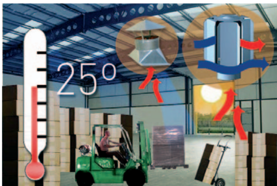
Recinto con ventilación adecuada.

Aeraspiratos ofrece un sistema de renovación mediante equipos de ventilación estáticos (Aeraspiratos), dinámicos (Aerasdin) o mixtos.