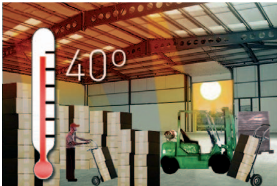
Recinto con ventilación deficiente.